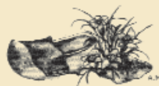
PRO LOCO RAVEO