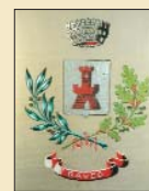
Comune di Raveo

(Dal testo “La Cjarnie in t'un pirôn” della Scuola Media Statale di Villa Santina)